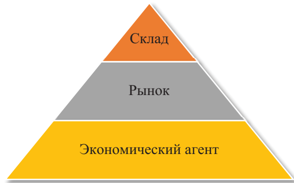
Иерархия агентов модели Hierarchy of agents in the model

1. Сортировка предметов внутреннего рынка согласно закону выявленных предпочтений