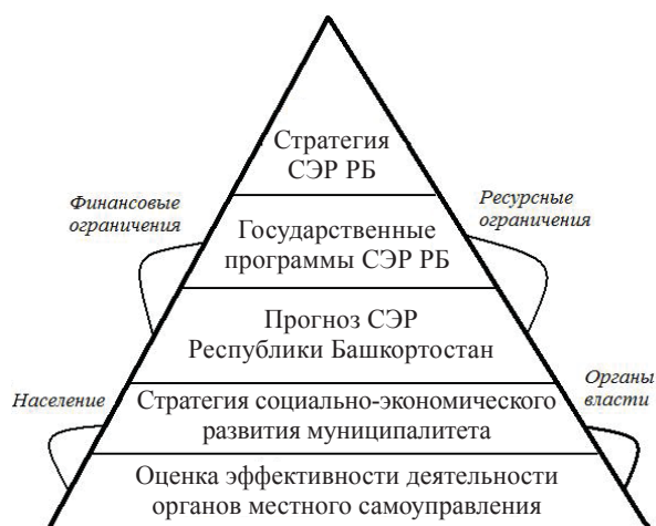
Рис. 2. Схема оценки эффективности деятельности ОМСУ в социально-экономической системе

Таким образом, на основе анализа можно сделать вывод о необходимости оценки рекомендуемых показателей, так как они более точно представляют эффективность управления социально-экономическим развитием территории. Также нужно подчеркнуть и важность самой оценки деятельности ОМСУ, которая отражена на рис. 2.