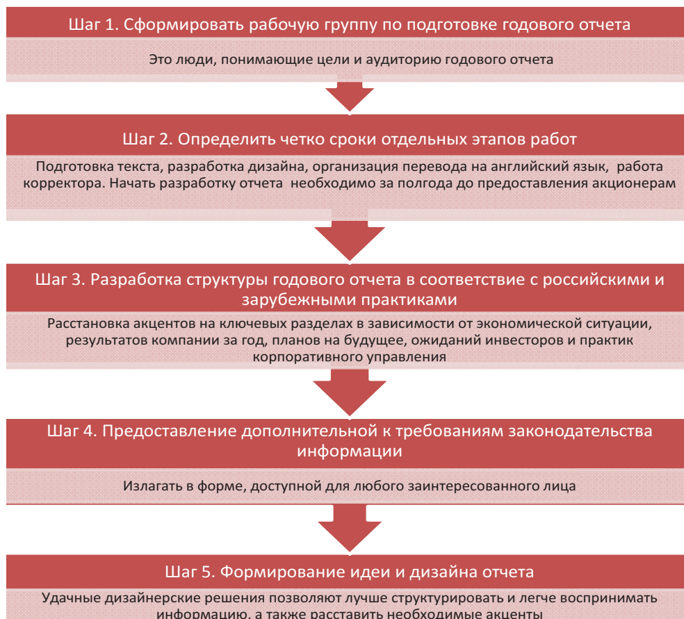
Алгоритм создания успешного годового отчета для ПАО «ВымпелКом» Algorithm for creating a successful annual report for PJSC «VimpelCom»

В качестве рекомендаций для ПАО «ВымпелКом» можно предложить алгоритм создания успешного годового отчета (рисунок) [7, с. 58].