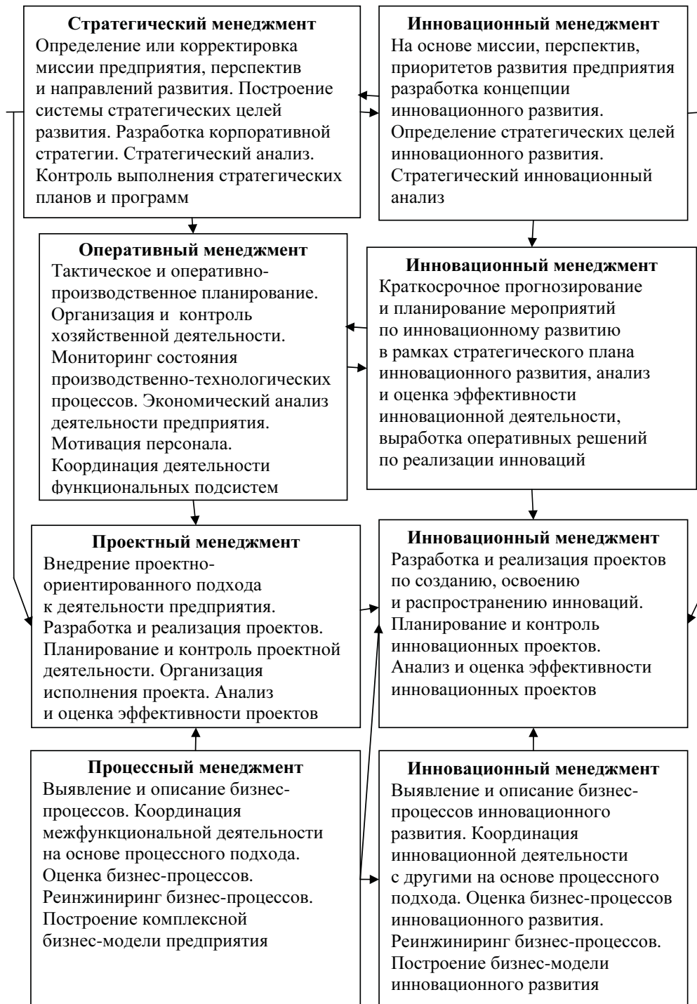
Интеграция менеджмента в процессе управления инновационным развитием промышленного предприятия