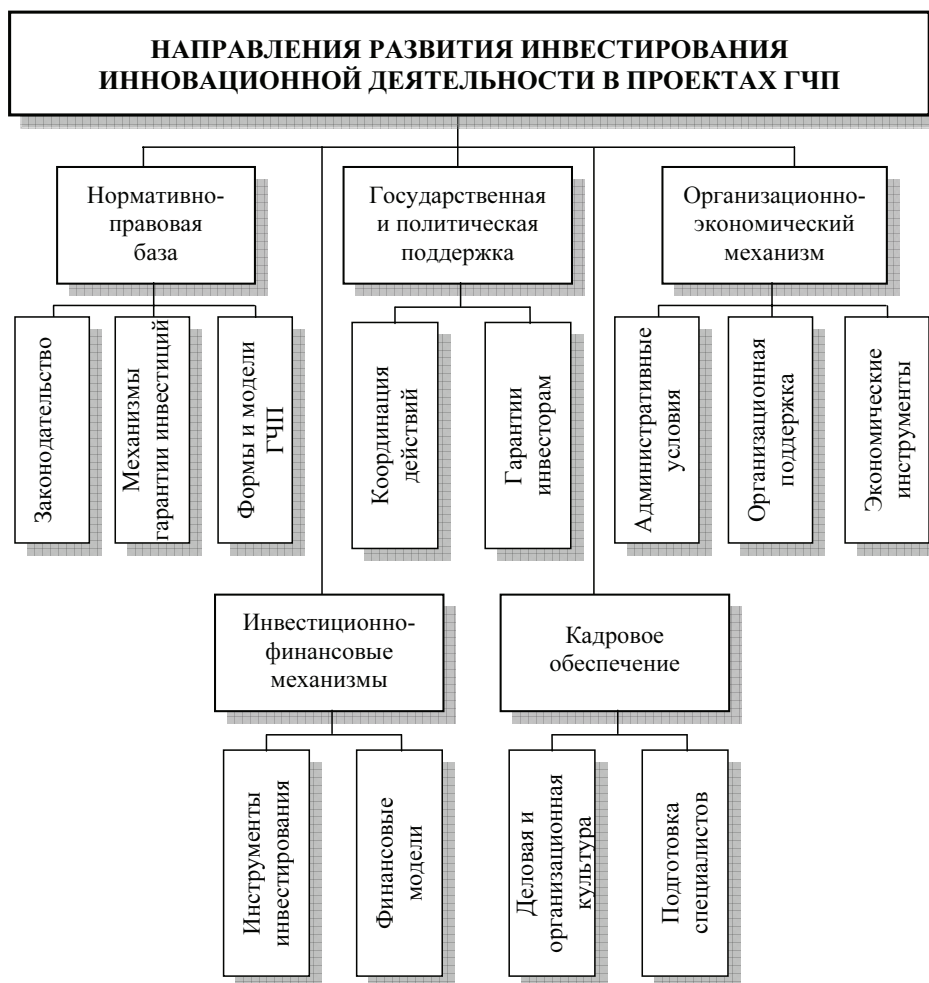
Направления развития инвестирования проектов ГЧП в инновационной сфере

Поэтому крайне важны формирование институциональной среды реализации проектов ГЧП и развитие инфраструктуры государственно-частного партнерства в соответствии с приоритетами экономического развития российской экономики. Анализ практики ГЧП позволяет сформулировать основные направления развития инвестирования проектов ГЧП в инновационной сфере для их успешной реализации (рисунок).