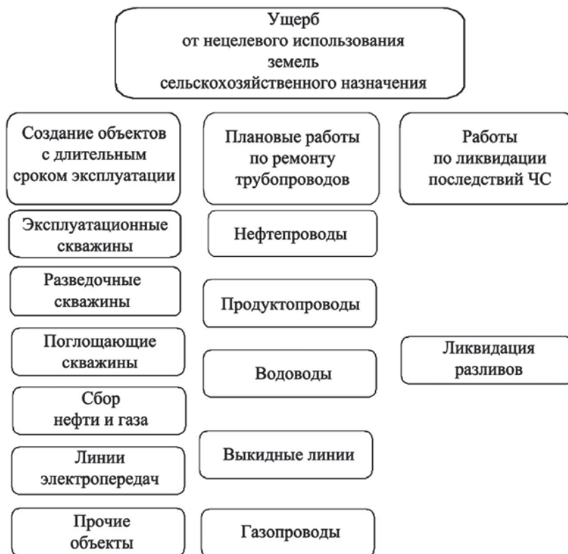
Источники возникновения ущерба при нецелевом использовании земель сельскохозяйственного назначения

возможности использовать первую методику [10]. Поэтому при расчете приходится основываться на предложенной классификации проводимых работ (рисунок).